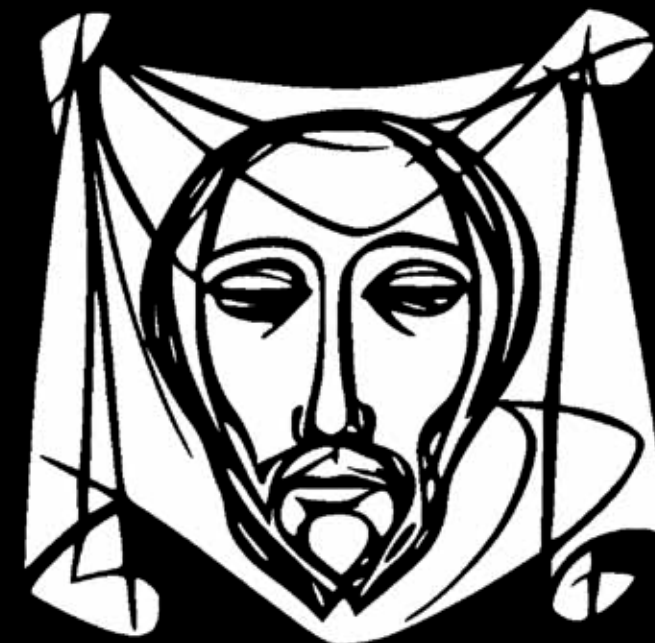
Sainte-Face du Christ, voile de Sainte Véronique

Oratoire de la Sainte-Face Espace Catherine de Sienne